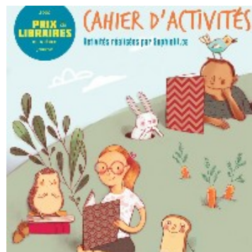
Cahier d'activités du Prix des libraires | Jeunesse